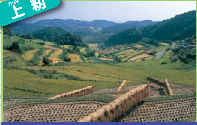
「耕して天に至る」の表現のごとく地域の最高峰にため池があり周辺の山とよく調和している棚田