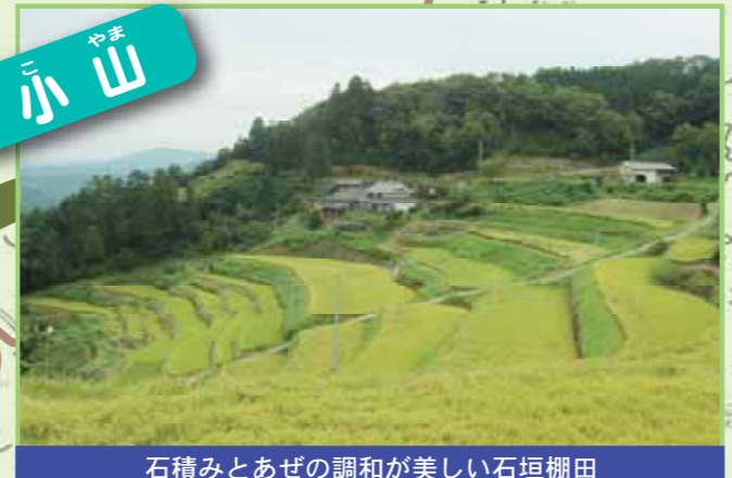
石積みとあぜの調和が美しい石垣棚田