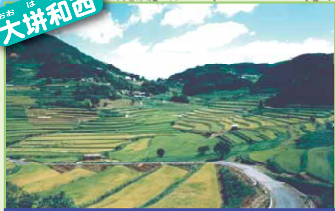
42ha850枚が360度すり鉢状に一望できる岡山の代表的な棚田