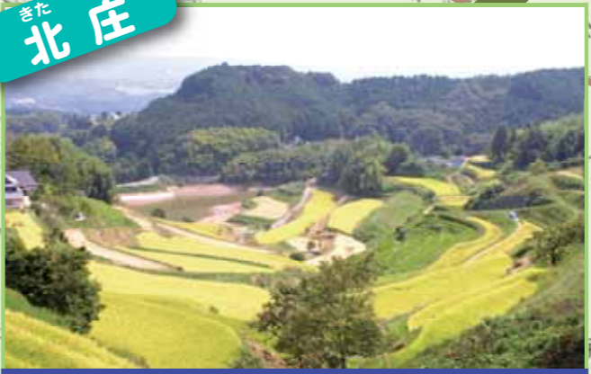
日本一の面積を誇り、谷、尾根筋に広がる棚田